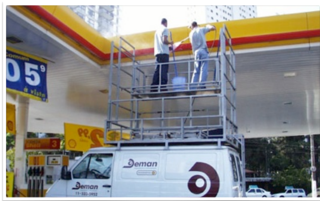
REDE DE POSTOS DE COMBUSTÍVEL SHELL BAHIA – SERGIPE – ALAGOAS – PERNAMBUCO – CEARÁ – MARANHÃO E PARÁ RENOVAÇÃO DE SISTEMAS DE ARMAZENAMENTO E ABASTECIMENTO DE COMBUSTÍVEIS