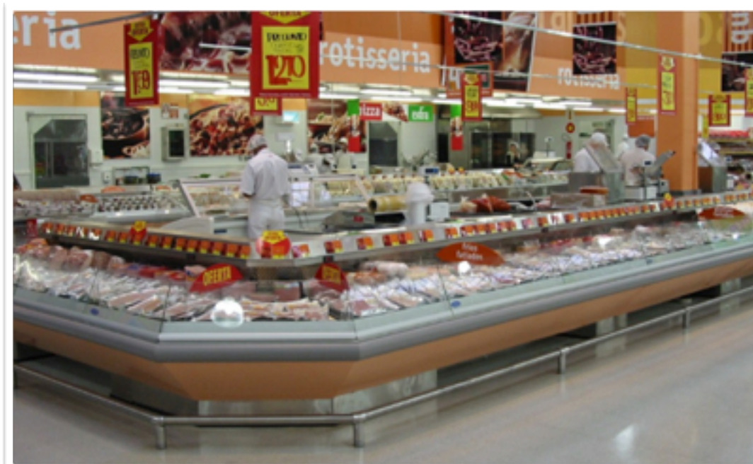
A EXECUÇÃO DO SISTEMA DE FRIO ALIMENTAR TEVE COMO FATOR DE ECONOMIA O APROVEITAMENTO DO CALOR REJEITADO PARA GERAÇÃO DE ÁGUA QUENTE PARA AS ÁREAS DE PREPARO DE ALIMENTOS E SANITÁRIOS