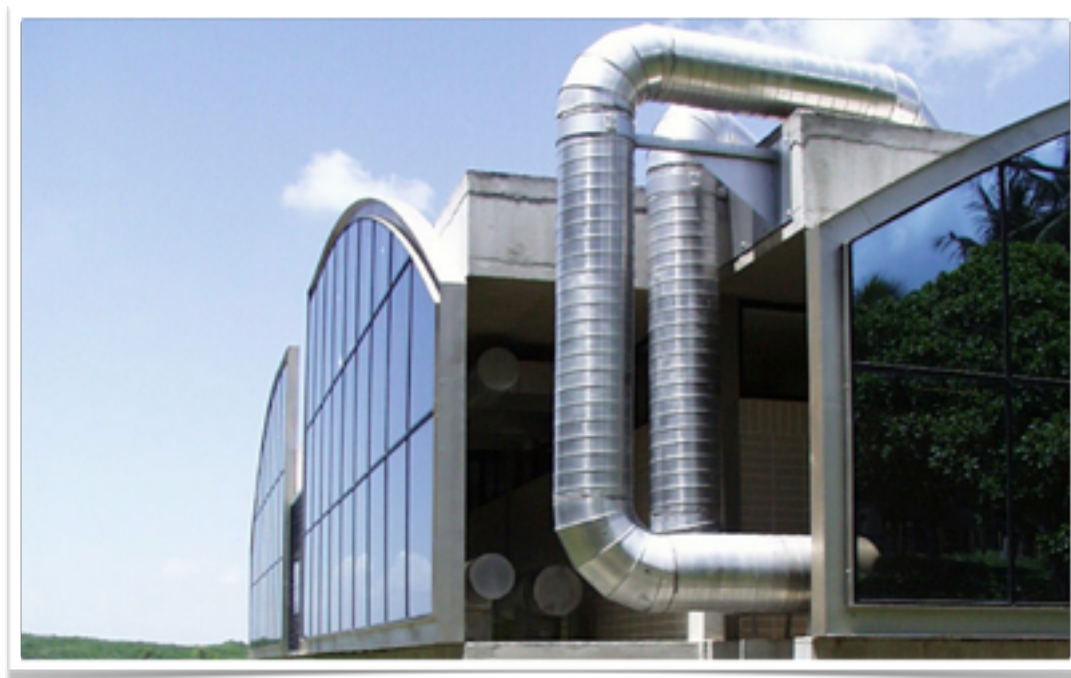
ESCRITÓRIO DA MATRIZ DO GBARBOSA ARACAJU - SE IMPLANTAÇÃO DO SISTEMA DE AR CONDICIONADO CENTRAL

Hospitalar – Clínicas de atendimento médico e Hospitalar em salas de cirurgia e unidades de tratamento médico