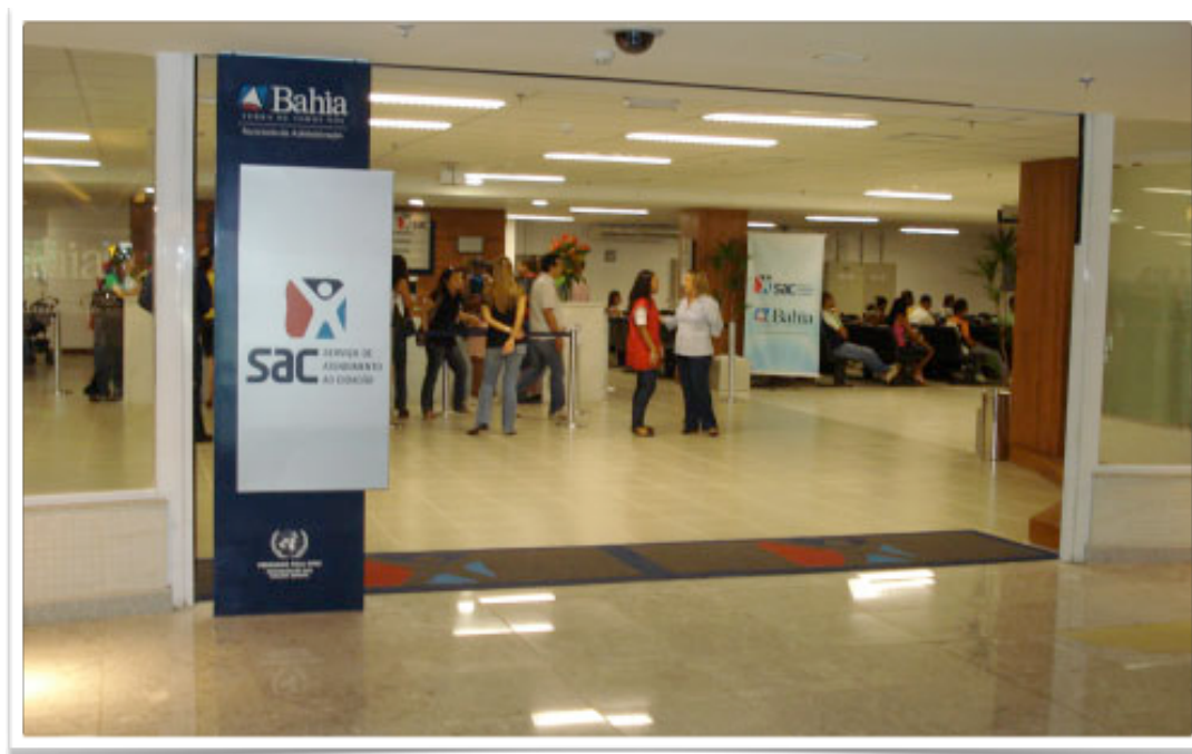
SAC – SERVIÇO DE ATENDIMENTO AO CIDADÃO LOJA SALVADOR SHOPPING IMPLANTAÇÃO DO SISTEMA DE AR CONDICIONADO