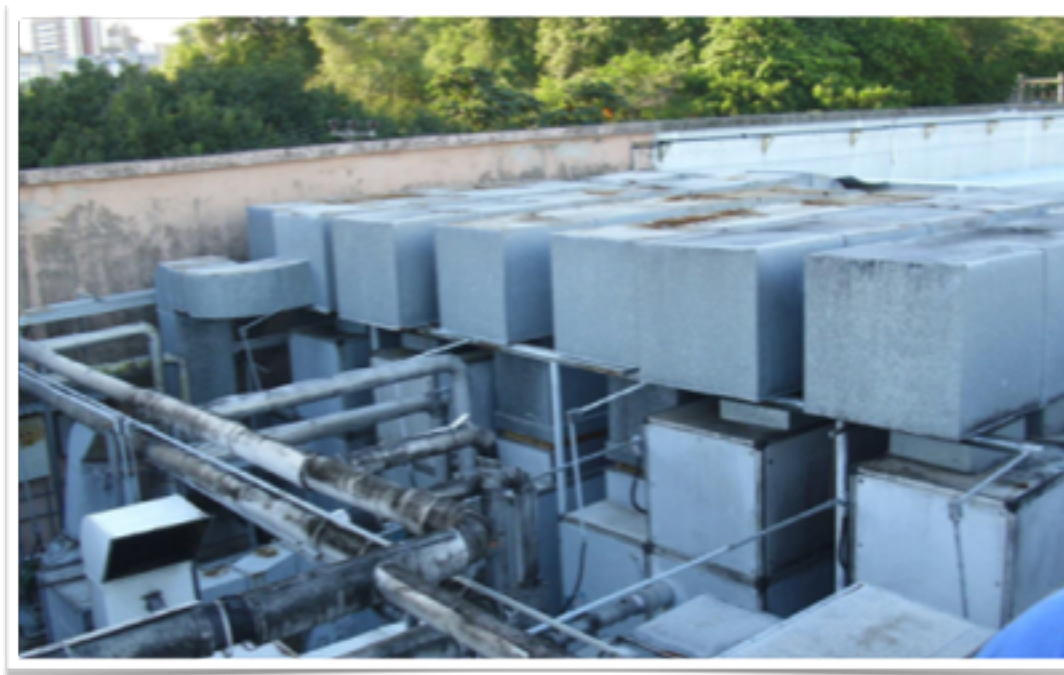
HIPERMERCADO EXTRA IGUATEMI FORTALEZA - CE - 20.000M2 RENOVAÇÃO DO SISTEMA DE ÁGUA QUENTE