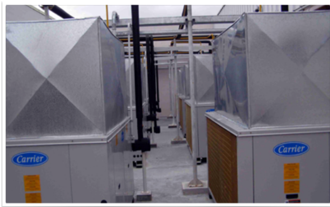
HIPER GBARBOSA - IMPLANTAÇÃO DE SISTEMA DE AR CONDICIONADO EM STIEP - SALVADOR/BA