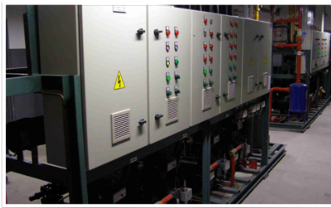
HIPER GBARBOSA - IMPLANTAÇÃO DE SISTEMA DE AR CONDICIONADO EM STIEP - SALVADOR/BA