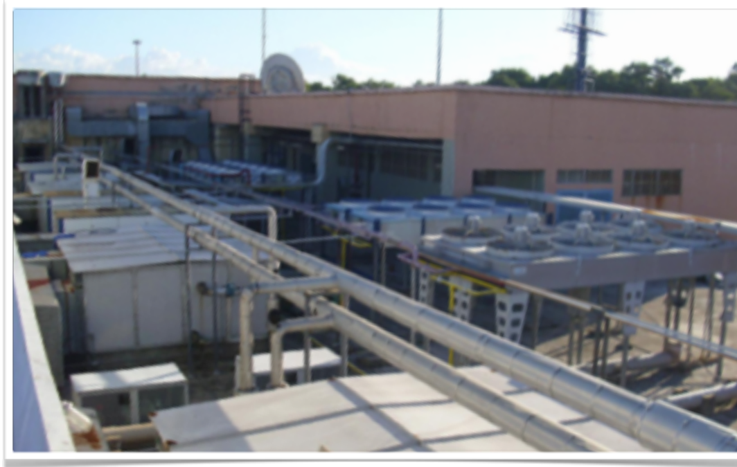
HIPERMERCADO EXTRA IGUATEMI FORTALEZA - CE - 20.000M2 RENOVAÇÃO DO SISTEMA DE ÁGUA QUENTE