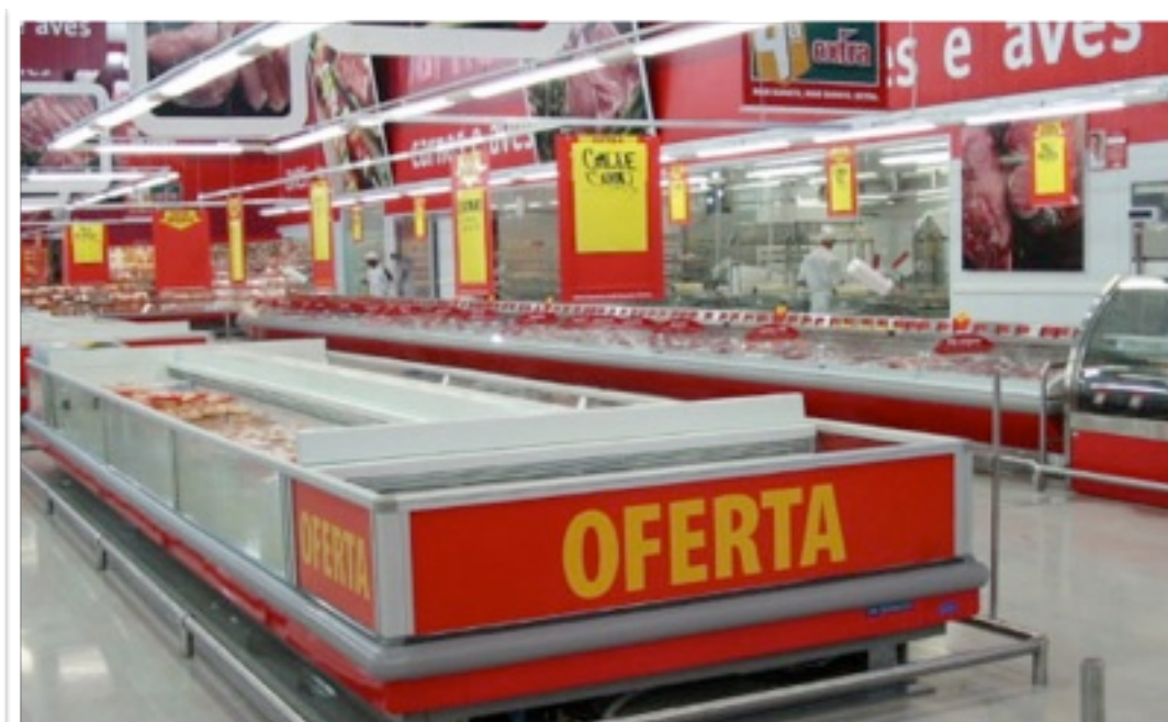
HIPERMERCADO EXTRA BELVEDERE BELO HORIZONTE - MG – ÁREA DE 25.000M 2 IMPLANTAÇÃO DO SISTEMA DE FRIO ALIMENTAR