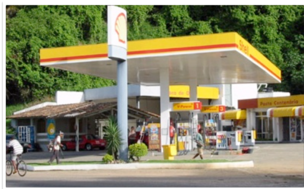
EXECUÇÃO DA SUBSTITUIÇÃO DE TANQUES E TUBULAÇÕES EM AÇO, POR TANQUE EM FIBRA E TUBULAÇÕES EM PAD EM DIVERSOS POSTOS NA REDE DE ABASTECIMENTO DO NORTE E NORDESTE DO PAÍS