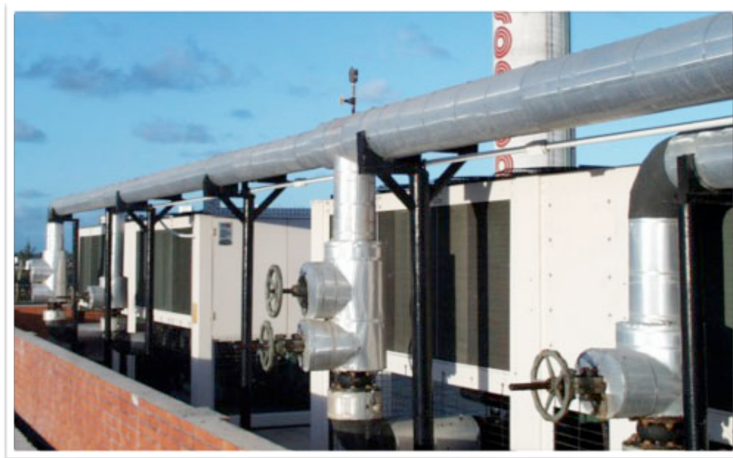
HIPERMERCADO G BARBOSA JARDINS ARACAJU - SE – ÁREA DE 15.000M2 EXECUÇÃO DO SISTEMA DE AR CONDICIONADO (600TR) E DO SISTEMA DE ÁGUA QUENTE