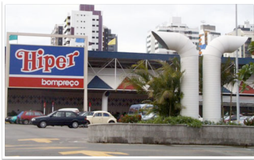
HIPERMERCADO BOMPREÇO IGUATEMI SALVADOR - BA IMPLANTAÇÃO DO SISTEMA DE EXAUSTÃO DA GARAGEM